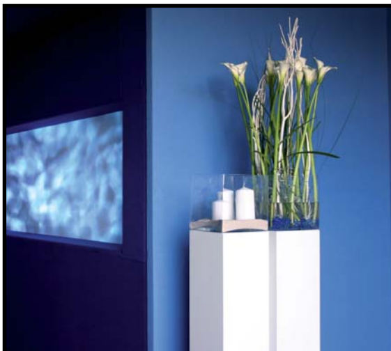
ArtikelNr.: 3250133 (Ohne Windlicht)