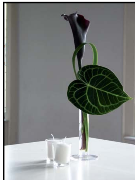
Artikelnr.: 3250149 (o. Kerzen)

Artikelnr.: 3250119 Artikelnr.: 3250129 Artikelnr.: 3250139 Artikelnr.: 3250149