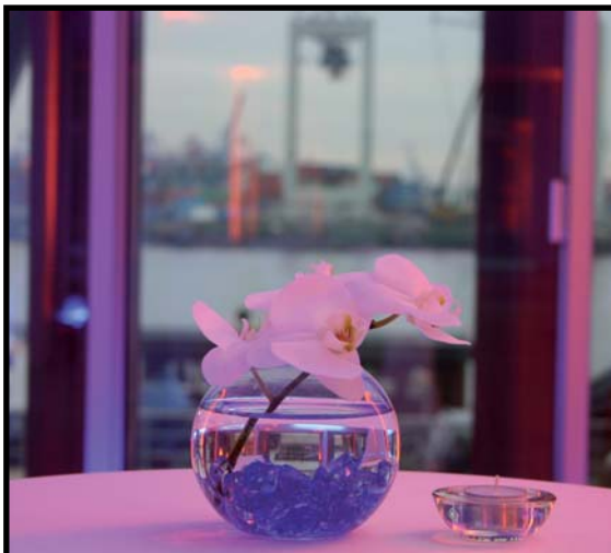
Artikelnr.: 3250139 (o. Kerzen)